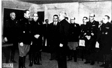
Il Presidente dell'Enia, interpretando il servizio del funzionario e di tutto il personale dell'Enia, riprende il Ministro Alfieri per l'abbonamento della loro qualità LUCE.

Il programma attraverso a questo Centro di Preparazione Radiofonica, che è stato da noi concepito come nuovo dal quale l'attività di lavoro nel piccolo istituto per l'Enia.