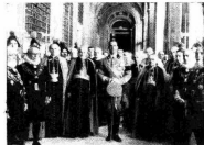
Il vescovo di Palermo in Vaticano per la visita di cordoglio.

Nella Sua infinita bontà il Signore ha voluto che il Reo Vercini, l'uffizio di stampa apostolico, potesse trasmettere accuratamente gli ordini su questa duplice importante visione: l'attualità dei Veneri italiani in Roma, per celebrare solennemente il Decennale della Conciliazione tra Chiesa e Stato e lo schieramento delle mille istituzioni di Pio XI nel confuso da dove partono, cioè le armi materali, quelle nei meno materiali della propaganda cattolica re-