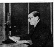
The President, Ambassador and Deputy general of the Radio RAI