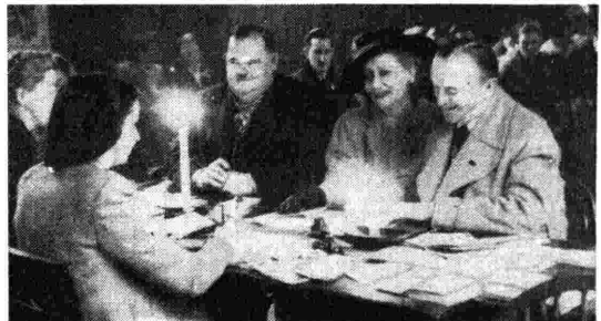
Tutto il mondo è paese: Stan Laurel e Oliver Hardy, in visita a Londra, ritirano le loro carte annonarie alla oscillante luce delle candele.