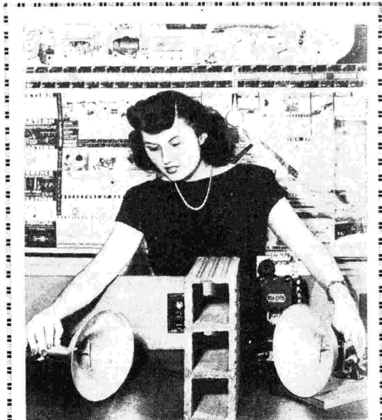
Solide pareti non sono d'ostacolo a queste micro-onde. La « General Electric » ha ideato l'impiego di onde radio ad alta frequenza per « vedere » attraverso e intorno a un ostacolo. Questa graziosa ragazza mostra qui come si fa a « guardare » attraverso un blocco di mattoni.