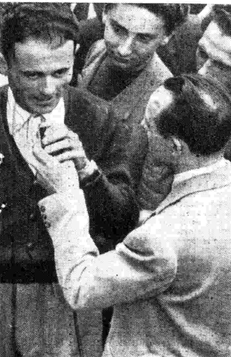
... viene alle 14,35 (escluso giovedì) e alle 19,30 (Rete Rossa e Azzurra).

Domenica , ore 21,05: Musica leggera per orchestra d'archi (Rete Rossa) - Lunedì , ore 22,20: Fantasia di canzoni e ritmi (Rete Azzurra) - Martedì , ore 18: Orchestra Nicelli (Rete Azzurra) - Mercoledì , ore 20,28: Orchestra Petralia (Rete Rossa) - Giovedì , ore 13,15: Orchestra Ferrari (Rete Rossa) - Venerdì , ore 20,28: Orchestra Armoniosa (Rete Azzurra) - Sabato , ore 20,28: Orchestra all'italiana (Rete Rossa).