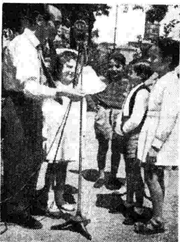
Anche i più piccini non si sgomentano dinanzi al microfono. I bimbi non conoscono il «microfono».

Nell'intento di rendere sempre più intima e cordiale questa collaborazione abbiamo voluto fare di più: sul finire dell'anno scolastico ci siamo recati in alcune scuole dalle quali abbiamo effettuato delle trasmissioni. Si tratta di particolari trasmissioni nelle quali i veri protagonisti sono gli alunni stessi che parlano agli scolari di tutta Italia, della loro vita, delle loro iniziative, dei loro sogni e delle loro speranze.