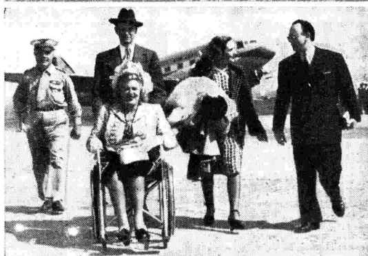
Marjorie Lawrence, una delle più pure voci d'America, è giunta in volo a Parigi, dove canterà, tra l'altro, per i microfoni della radio francese. Come vedete è paralitica, ma ciò non vale ad alterare la serenità del suo sorriso.