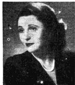
Il soprano Elio Traube ha cantato recentemente ai microfoni di Radio Roma

Musicalmente l'operetta è ricca di spunti oltremodo felici, e sembra essere una vera glorificazione del valzer viennese, che vi scintilla in mille luci e in mille accenti