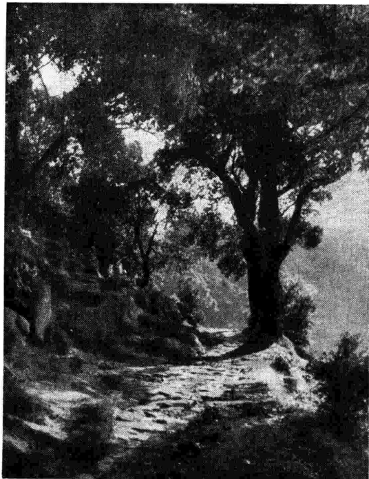
Questo scenario sarebbe degno di aver ispirato le più belle pagine «boschive» della letteratura musicale romantica.