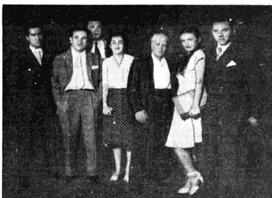
Tullio Serafin con gli interpreti di «Lodoletta», trasmessa il 15 luglio scorso dagli audiotri di Radio Roma

17,30 Musica e musicisti d'America. 18 Settimana nel mondo. 18,15 Le danzanti. 19,15 Respighi: Le fontane di Roma. 19,30 Ritmi allegri. 19,50 Chi è? 20 Segnale orario e notiziario. 20,15 Musica per voi. 21 Opera (ed. fonografica). 23 Ultime notizie. 23,15 Continuazione dell'opera. Ind: Chiusura.