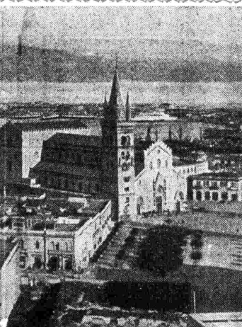
vigile scolta alle porte del Tirreno. Sulle sue rive che il Santo Padre accenderà dal Vaticano con un polsi II e Roma II, trasmetteranno la cronaca della più pronunciata dal Santo Padre. stesso ».

Domenica , ore 22: Orchestra diretta da Campese (Rete Rossa) - Lunedì , ore 20,45: Orchestra diretta da Mojetta (Rete Azzurra) - Martedì , ore 14,35: Orchestra all'italiana diretta da L. Gentili (Rete Rossa) - Mercoledì , ore 20,28: Radiorchestra diretta da Gallino (Rete Azzurra) - Giovedì , ore 20,28: Orchestra diretta da V. Manno (Rete Rossa) - Sabato , ore 13,15: Radiorchestra (Rete Azzurra) - Sabato , ore 13,10: Orchestra all'italiana (Rete Rossa).