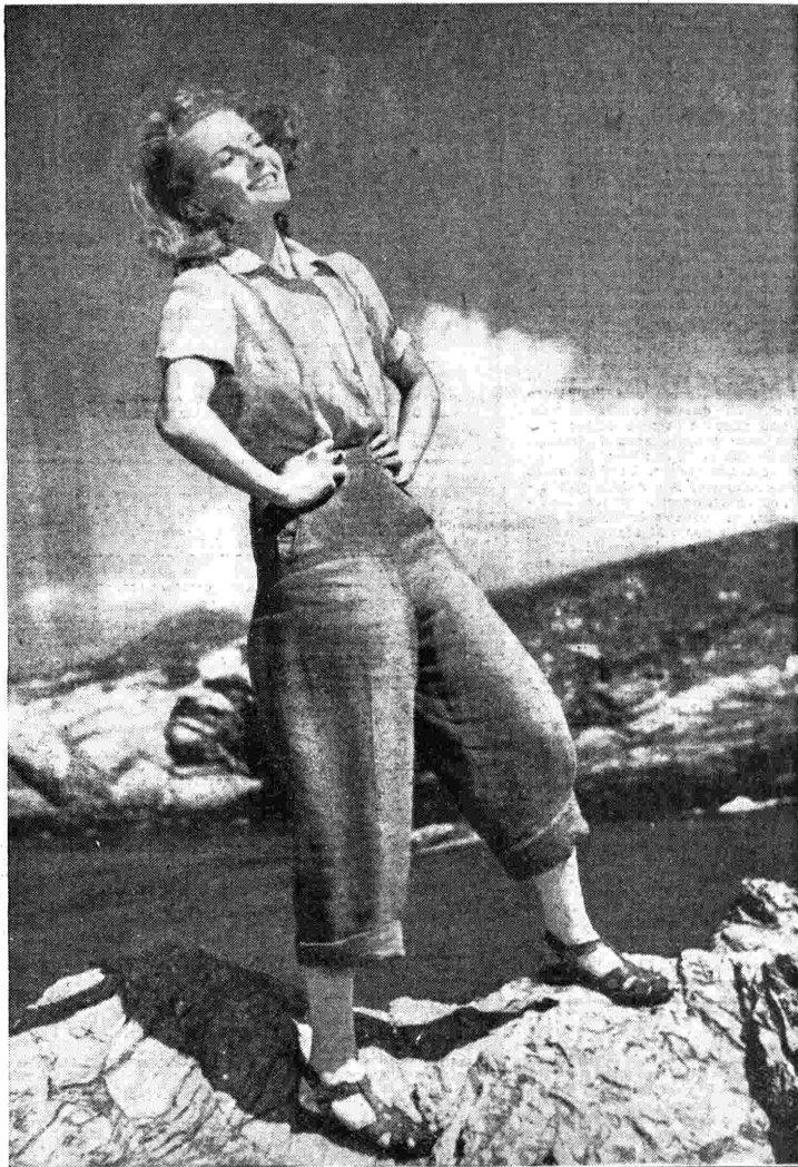
ECCO UNA FANCIULLA FORTUNATA CHE "EVADE" DALLA VITA CITTADINA