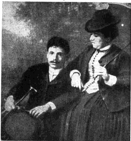
Matilde Serao con il marito, Edoardo Scarfoglio.

Perchè questa donna, che fu così abbondante e anche, nei momenti meno controllati, «torrenziale» (l'aggettivo è del Bоргese, che pur l'ammirò), ebbe, senza dubbio, come ogni vero artista, se pur più raramente le donne, il senso delle cose essenziali, quando si accostava a un tema che le si addiceva. E, se molte sue pagine peccano, invero, di vago e vuoto sentimentalismo, nè la lagrima troppo facile è assorbita, rasciugita dalla forza dello stile, e ciò spiace, fa caduco il suo dire, tante altre — e sono sufficienti non alla fama soltanto, ma alla gloria — appaiono di così schietta forza, da porla a pari coi più gagliardi prosatori dell'epoca, non soltanto italiani. Mai è violentata la sua natura quando rimane nel piccolo mondo dal quale anch'ella aveva avuto origine: se pur in artista di razza possa dirsi che dell'origine rimanga traccia. E', quel mondo, la piccola borghesia napoletana: povera, dignitosa, infelice, ancor popolo e già medio ceto — un ceto, comunque, in formazione, e della formazione l'artista ritrae tutto il dolore dello sforzo — costretta in meschini ambienti, e