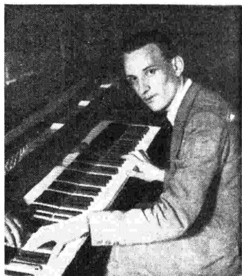
Arturo Benedetti Michelangeli partecipa come solista alla «tournée» dell'Orchestra sinfonica di Torino della Radio Italiana.

Organizzare un giro artistico per una così numerosa massa orchestrale e in uno spazio di tempo tanto limitato, è stata una impresa logistica non indifferente, alla cui preparazione la Radio Italiana ha dedicato particolare cura, specialmente per quanto concerne la predisposizione dei trasporti. Si è cercato infatti di assicurare in ogni modo il benessere degli orchestrali, indispensabile anche