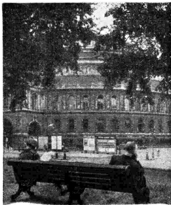
La Albert Hall di Londra, sede dei Promenade Concerts, dove la nostra orchestra terrà un concerto.