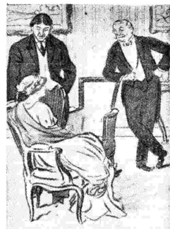
Una scena de «La raffica» in un disegno di Renfer