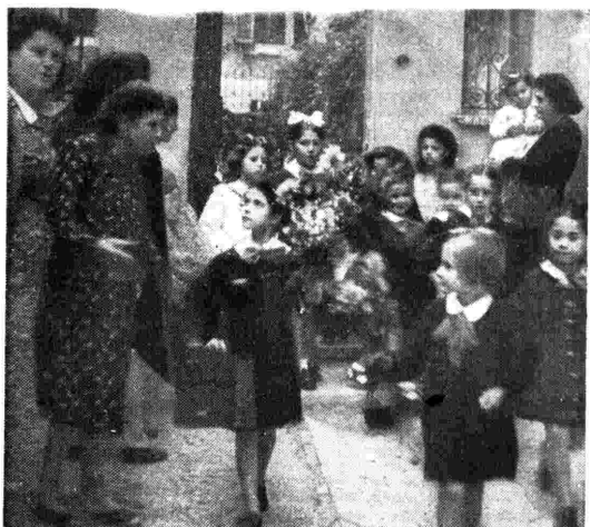
Riapertura delle scuole. - Anche la radio è stata puntualmente all'appuntamento e ha ripreso il ciclo delle sue trasmissioni per gli scolari collegato con insegnamento.

7,15 Calendario e musiche, 7,30-7,45 Segnale orario e notiziario, 11,30 Ritmi, canzoni e melodie, 12,10 Dal repertorio fonografico, 12,58 Oggi alla Radio, 13 Segnale orario e notiziario, 13,15 Orchestra Zeme, 14 Musica varia, 14,15-14,30 Nuovo Mondo, Listino Borsa, 17,30 Fantasia musicale, 18 Orchestra Cetra diretta da Beppe Moietta, 18,45 Cronache d'America, 19 Concerto del violoncellista Attilio Ranzato, 19,30 Terza