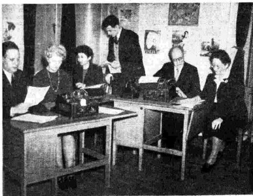
Negli uffici della B.B.C., per le trasmissioni dedicate all'Italia, si cura anche la compilazione di aggiornati notiziari economici.

Rotschild uomo di grande ingegno, utilizzò i colombi viaggiatori, che giunsero assai prima degli uomini: a recargli la notizia della sconfitta di Napoleone. Così poté puntare al rialzo e realizzare una fortuna. Anche se la radio ha sostituito vantaggiosamente i piccioni