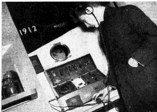
Alla Nostra Marconiana di Londra. - Modello di apparecchio per il collegamento radio con le navi.