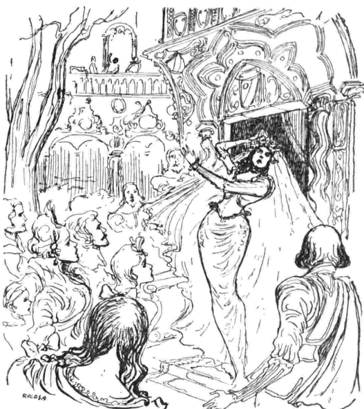
La scena della pazzia nella «Lucia di Lammermoor». In essa Donizetti ha trovato una delle espressioni più originali e vive di tutta la sua arte.

La sera del 26 settembre 1835 il pubblico del San Carlo decretava alla Lucia il trionfo.