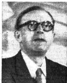
Il grande economista tedesco Wilhelm Röpke, autore di alcuni studi fondamentali sui problemi economico-sociali del nostro tempo.

la borsa valori di New York o i cambi valutarî o il movimento del porto di Genova. Eppure questi servizi hanno una grande utilità, non meno della rubrica settimanale Per gli uomini d'affari e del Notiziario economico-finanziario.