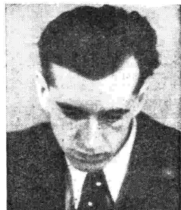
Alfredo Simonetto dirige questa sera il Concerto di musiche operistiche