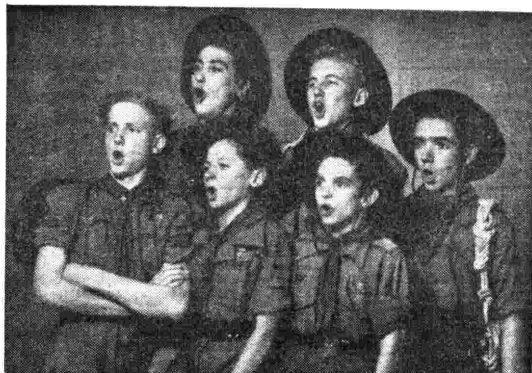
Alcuni giovani elementi del gruppo corale di Rovereto che ha recentemente cantato a Radio Bolzano.

GENOVA I: 14.18 Notiziario interregionale ligure-piemontese - 14.28-