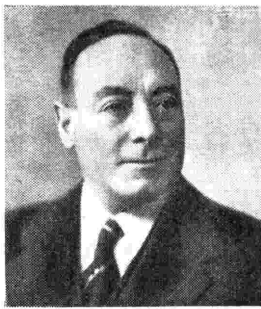
Giuseppe De Luca, il grande baritono, festeggia oggi i suoi cinquant'anni di attività artistica. (Ore 22.25 - Rete Rossa).

20.15 Notizie sportive. 20.30 Musiche di Manhattan. 21 Concerto da camera. 21.30 Commedia in un atto. 22.05 Or-