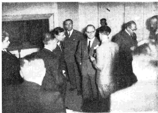
Il Ministro Gonella e il Presidente della RAI fra i membri della Commissione Consultiva di «La Radio per le Scuole» in occasione dell'inaugurazione dell'anno scolastico radiofonico il 24 ottobre 1947