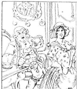
Prima scena de «La serva padrona»: Serpina prende a gabbo Ubaldo e le sue bizze proteste.

hato e geniale che unisce, in una perfetta espressione di bellezza la concezione artistica del librettista — il modesto Federico — a quella del musicista sommo. Dico Giovanni Battista Pergolesi. escei