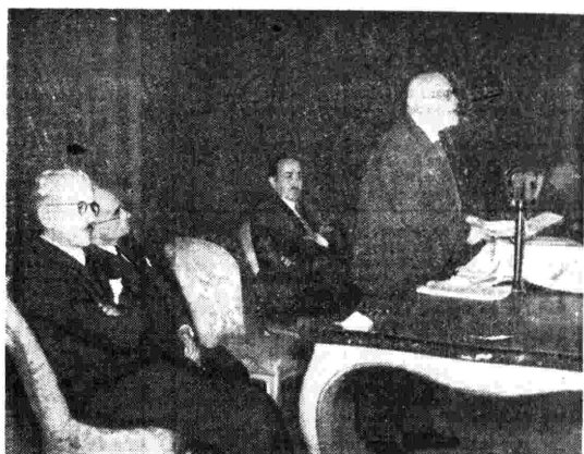
Il primo convegno a Roma del movimento federalista europeo. Parla Salvemini.

7,15 Calendario e musica del mattino. 7,30-7,45 Segnale orario e notiziario. 11,30 Dal repertorio fonografico. 12,10 Musica operistica. 12,58 Oggi alla Radio. 13,35 Segnale orario e notiziario. 13,15 Orchestra (etra diretta da Beppe Moietta. 13,55 Musica varia. 14,15-14,30 Nuovo Mondo. Listino Borsa. 17,30 Fantasia musicale. 18 Orchestra sinfonica. 18,30 Musiche vocali russe. 19 Università per radio. 19,15 Musica da ballo. 19,30 Terza pagina. 19,45 Varietà musicale. 20 Segnale orario e notiziario. 20,15 Galleria della musica. 20,45 Trieste: spunti del suo passato. 21 Orchestra Melodica diretta da Guido Cergoli. 22 Melodie in ritmo. 22,15 Assoli di chitarra. 22,30 Musiche per la sera. 23 Ultime notizie. 23,15-24 Club notturno. RADIO SARDEGNA 7,45 Musiche del mattino. 8 Segnale orario. - Giornale radio. 8,10-8,20 Per la donna. Mamme e massaie. 12 Dal repertorio fonografico. 12,25 Musica leggera e canzoni. 12,45 I programmi della giornata. 12,40 Cantanti celebri di tutti i paesi.