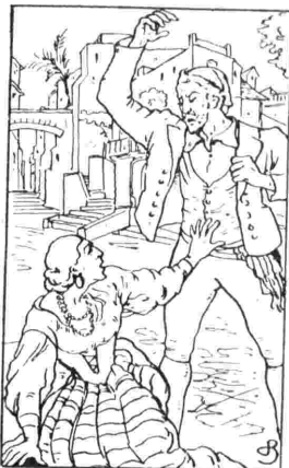
L'implorazione di Santuzza nella «Cavalleria Rusticana».

Le bizze ed i difetti della graziosa ed astuta servetta e il brontolare del burbero padrone — tutto apparenza — mirano solo ad una gioiosa conclusione: un gioco gar-