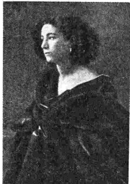
Sarah Bernhardt a vent'anni.

Altra cosa curiosa era il bisogno che ella aveva di tenere costantemente un fazzoletto nella mano sinistra; ne doveva comporre in grande quantità, perché durante il corso della recita ne usava parecchi, uno nuovo ogni volta che entrava in scena. E alla fine dello spettacolo molti andavano perduti o erano presi come ricordo dagli ammiratori entusiasti.