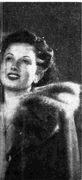
DIAMENTE UNA TRA LE PRETI DELLA-CANZONE