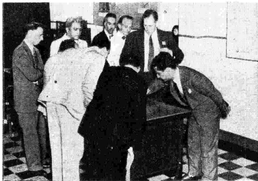
Alcuni membri della Conferenza Internazionale delle Telecomunicazioni esaminano un planisferico di antenna di un centro trasmettente americano.