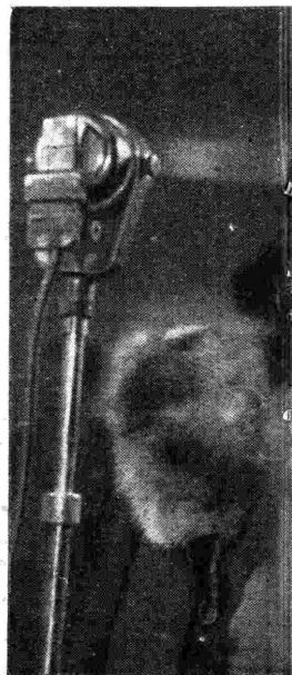
LEDA VALLI E INDUBBIO PIÙ ACCLAMATE INTERNAZIONALI