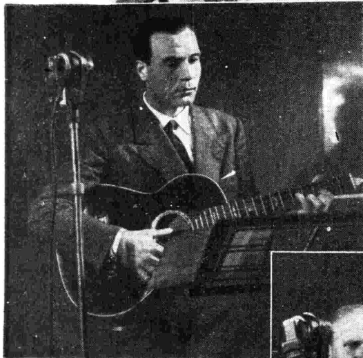
FILI CAPELLARO, IL NOTO CHITARISTA E CANTANTE INTERNAZIONALE

Chi ha ascoltato il primo sarà accorto; chi ascolterà per questo annuncio: ad ogni modo parte almeno un l'umorismo scenico e almeno i attori del nostro teatro nostro schermo. (Durante la