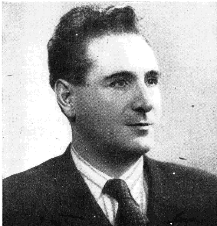
GIA OMO LAURI VOLPI, CHE RITORNA IN PATRIA DOPO UNA TRIONFALE TOURNEE DI CONCERTI A STOCOLMA, A BRUXELLES, A GAND, ANVERSA E ZURIGO E DOPO I SUCCESSI DI "TOSCA", A. REALE DI COPENHAGEN E "TOSCA", "RIGOLETTO", E "AIDA", ALL'OPERA DI PARIGI, HA VOLUTO DARE IL SUO PRIMO CONCERTO IN ITALIA AI MICROFONI DELLA RAI, IN COLLABORAZIONE CON MARIA PEDRINI E TITO GOBBI