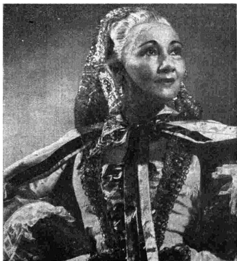
Elsa Merlini, mirabile interprete goldoniana partecipa alla trasmissione de «I rusteghi» di Carlo Goldoni, sabato 3 gennaio, ore 17, Rete Azzurra.