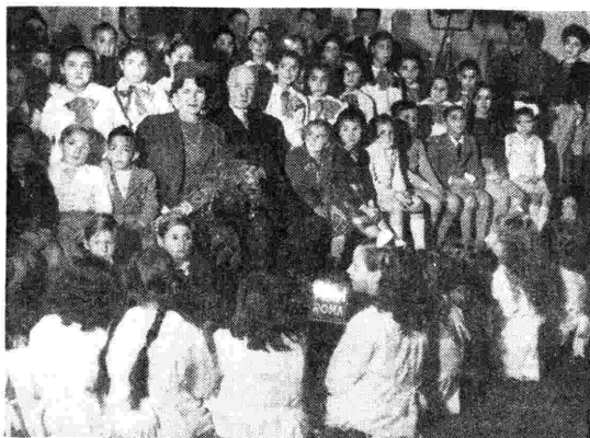
Il Ministro di Danimarca a Roma S. E. Otto Carl Mohr, con la sua signora a Radio Roma durante la registrazione del programma dedicato alla Danimarca.

«Ma quello che, secondo il mio parere, è in special modo più degno di rilievo e più bello, è che moltissime fra le famiglie danesi che hanno accolto i bambini erano famiglie che vivevano loro stesse in modeste condizioni.