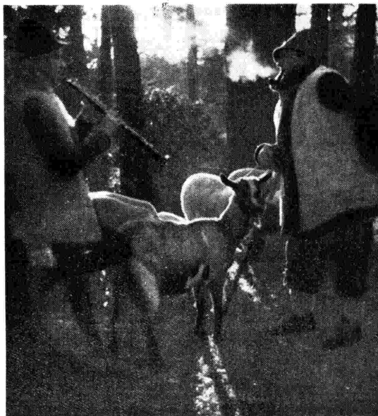
In occasione del Natale si ripete a Thiene ogni anno una caratteristica manifestazione di folclore: va sotto il nome di «Canti della Nina» ed avete avuto modo di ascoltarne la radiocronaca.

Nello stesso concerto, insieme al Don Giovanni , notissimo capolavoro della produzione sinfonica di Strauss, si ascolterà l'ultimo dei suoi poemi sinfonici, la vasta e grandiosa Sinfonia delle Alpi (1915). Nonostante l'ingenuità dell'assunto descrittivo (si tratta di raccontare in tutti i suoi particolari le vicende di un'escursione alpinistica, a cominciare dall'alzatacia mattutina, poi l'ardore impetuoso della prima salita, il graduale mutare del paesaggio che si fa da pastorale e idillio sempre più severamente alpino, l'affanno del sentiero smarrito in mezzo ai cespugli, la disumana e candida maestà del ghiacciaio, la cautela dell'arrampicata su roccia e perfino il brivido del piede messo in fallo, la conquista della vetta con una estatica e gloriosa visione, poi il ritorno, dove il tema della salita ritorna rovesciato, il temporale, il tramonto e il riposo serale all'ombra maestosa della montagna, il cui tema si profila un'ultima volta nella bruma sonora come la montagna stessa con la sua imponente mole nelle tenebre della notte), nonostante l'ingenuità dell'assunto descrittivo e la trascinante pienezza strumentale, è un'opera forte e sincera, dove circola veramente l'altra sana e frizzante dell'alta montagna e dove si esprime il dinamismo ottimismo ed attivo dell'autentico alpinista. m. m.