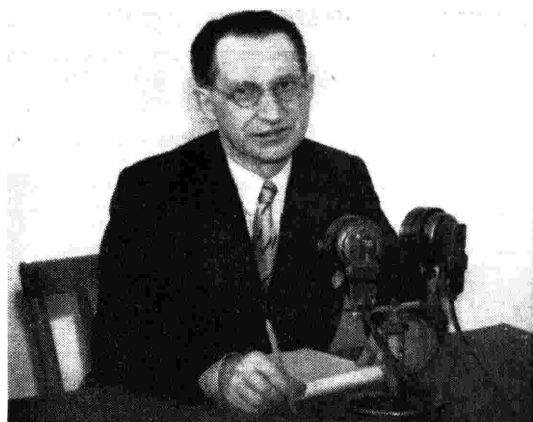
L'on. De Gasperi legge alla radio l'appello del Consiglio dei Ministri per il Fondo di Solidarietà Nazionale.