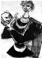
Amata in un'opera di Scapuzza che l'artista aveva scritto anni prima nella forma del quiddone «Il Tempo», in Galleria Colonna

ma, un Amleto stupendo che ha superato il ricordo di tutti quelli visti. Ha un'aria da Silvio d'Amico, ha l'aspetto di un eroe moderno, di un eroe di oggi. Ha detto Romano Corbelli, e Silvio d'Amico ha ammesso di aver mai assistito, neanche all'estero, a una recitazione dell'Amleto ricca di suggestioni così profonde.