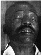
Big Bill Broonzy mentre canta un suo blues.

to ma il « blues» è verso di una certezza che ancora oggi scuoteva le ossa, la certezza semplice e solida, della verità prima di qualsiasi « virtuosismo» . Sotto a vedere il sole caldo di sera — perché il mioigarette ha lasciato niente addò. — Si dormiva nei protetti angoli — propendo il mio fucile che me ne andavo, solo. — Una donna di St. Louis, nei suoi anni di dimoranti — Senza averci il mio sono ai lati del mio corpo — al di là della e di arrivare il capello. — L'uomo che lo sono con se andò più via — e St. Louis è finita, e finite, me sono triste io. — In una quell'uomo — la sua come uno ascoltò una la mia lotta — come un soldato del Kentucky la sua lotta di morte. — Un uomo il mio fucile fino a quando non morì. — Più nero della montagna di terra e alberi a basso e lontano — l'uomo più nero di St. Louis — più nero di una notte di giugno, più dolce della terra. »