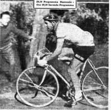
...e avrà anche sporcizia di terreno che la vita al galoppo e agli altri and.