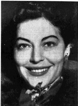
Ana Gardner, una delle dive più ammirate del firmamento di Hollywood, prenderà parte, insieme con altre stelle dello schermo, alla trasmissione di «Palcoscenico girovolo» che verrà effettuata lunedì, alle ore 18.45, sul Secondo Programma

EDIZIONI RADIO ITALIANA VIA ARSENALE 21 - TORINO che invierà il volume franco di spese contro anticipo del relativo importo. I versamenti possono essere effet- tuati sul conto corrente postale n. 2/37800